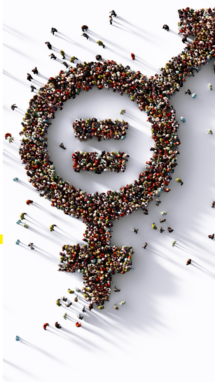
Figura che si occupa di guidare le organizzazioni verso l'adozione di un sistema di gestione per la parità di genere e ne misura e rendiconta i dati con l'obiettivo di colmare i Gap esistenti e bloccare l'insorgenza di altri disparità in qualsiasi ambiente dell'azienda.

Adottare un sistema di gestione per la parità di genere rappresenta un motore di crescita economica e di sviluppo per le aziende.